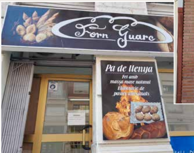
FACHADA TIENDA TORTOSA