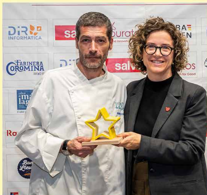
PERE COSTA FORN DE LA LOLA