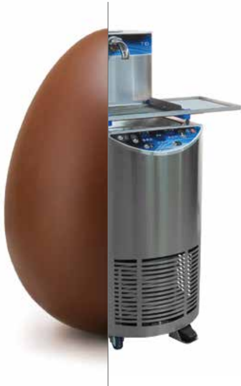
POMATI T10 Atemperador