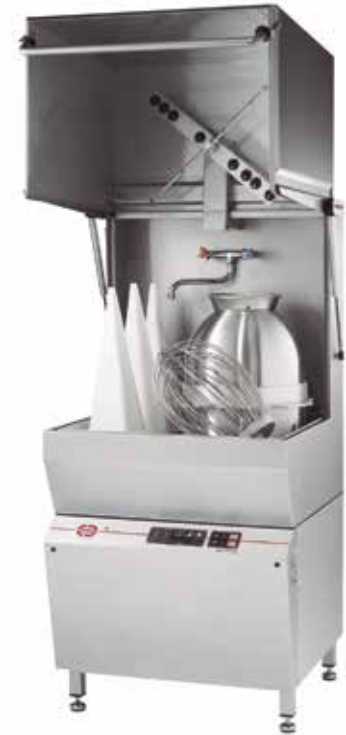
JEROS 9110 Sistema de lavado