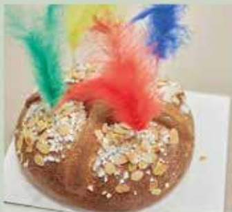
Segundo premio, Forn i Pastisseria Gil de Barcelona

Dos de nuestros hornos agremiados han conseguido el segundo y tercer premio en la categoría Mona de Pascua tradicional.