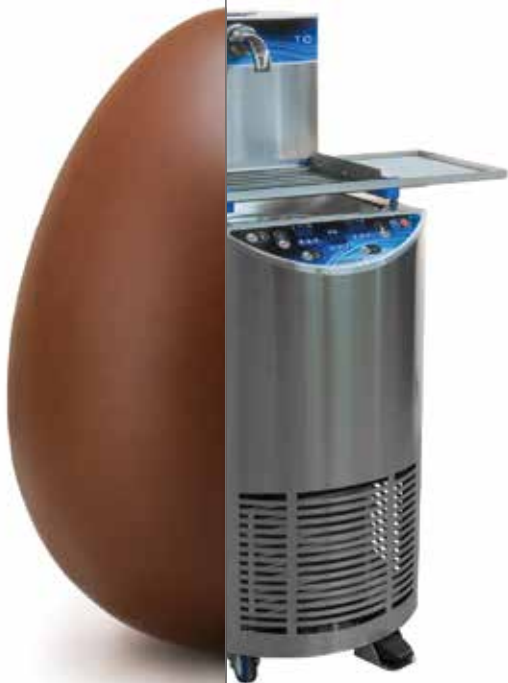
POMATI T10 Atemperadora