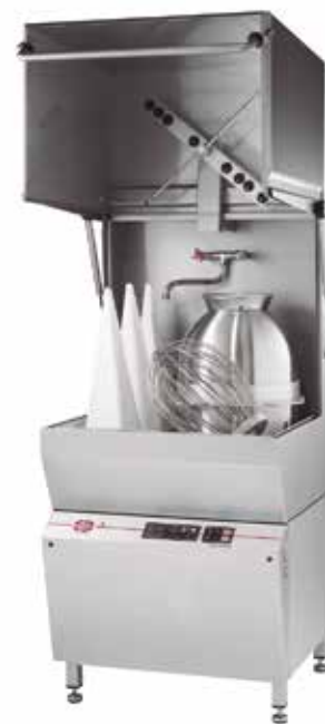
JEROS 9110 Sistema de lavado