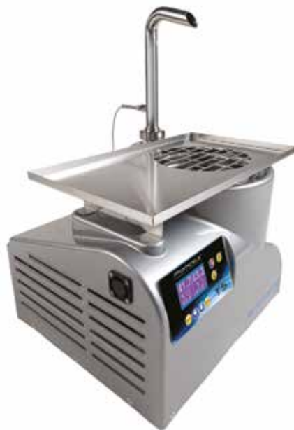
POMATI T5 Atemperadora