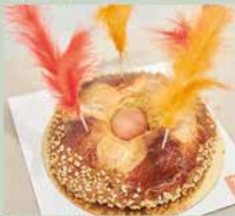
Tercer premio Forn Panes Creativos de Barcelona

Esta segunda edición, liderada por pasteleros y panaderos de toda Cataluña, ha recibido calidad, artesanía y esfuerzo a partes iguales en un momento difícil por el sector.